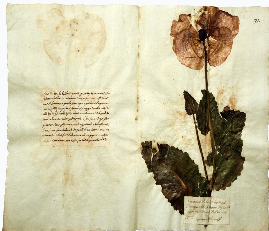
Campione dell'Erbario dei Cappuccini di San Quirico d'Orcia (SI)

Registrazione presso il Tribunale di Siena