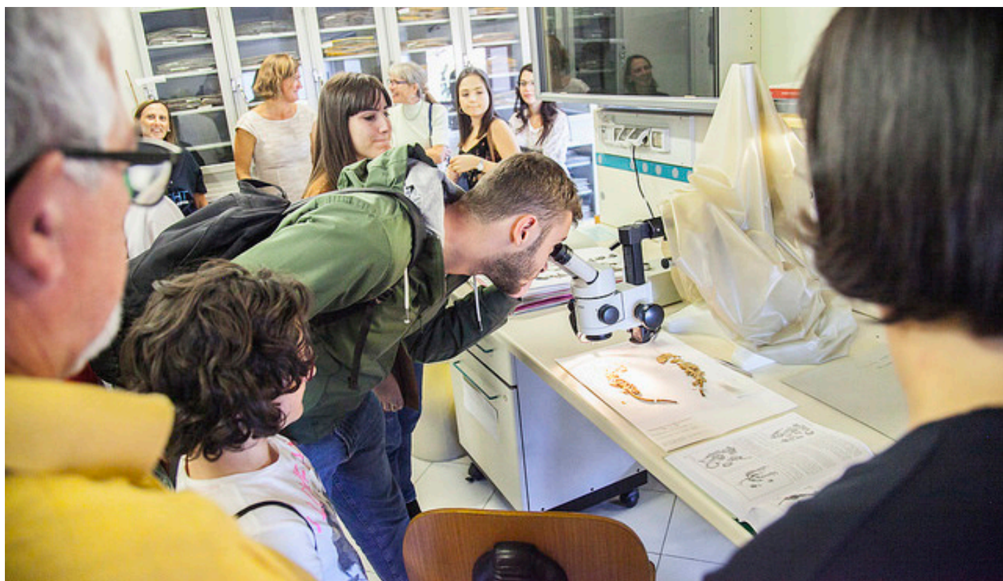
Laboratorio di identificazione piante; in alto: campioni di erbario.