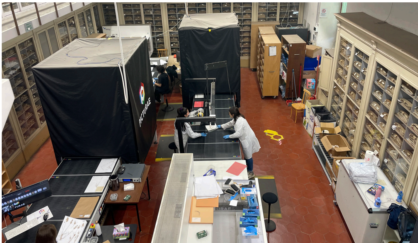
Una fase della digitalizzazione nell'Erbario centrale italiano dell'Università di Firenze; in alto: un momento dell'acquisizione immagini.

Questo sistema consente di digitalizzare circa 10.000–12.000 campioni al giorno, garantendo al contempo la massima integrità del materiale. Per quanto riguarda l'Erbario di Siena, le attività sono iniziate il 28 ottobre 2025 con il trasferimento di 144 scatole contenenti i fogli d'erbario, destinati alla disinfestazione e alla successiva digitalizzazione a Firenze. I materiali sono rientrati a Siena il 5 dicembre 2025. Il progetto trasforma così gli erbari italiani da collezioni fisiche circoscritte in un mega-database virtuale e dinamico, rafforzando la ricerca botanica e mettendo a disposizione una banca dati essenziale per lo studio dei cambiamenti climatici e della biodiversità su scala globale.