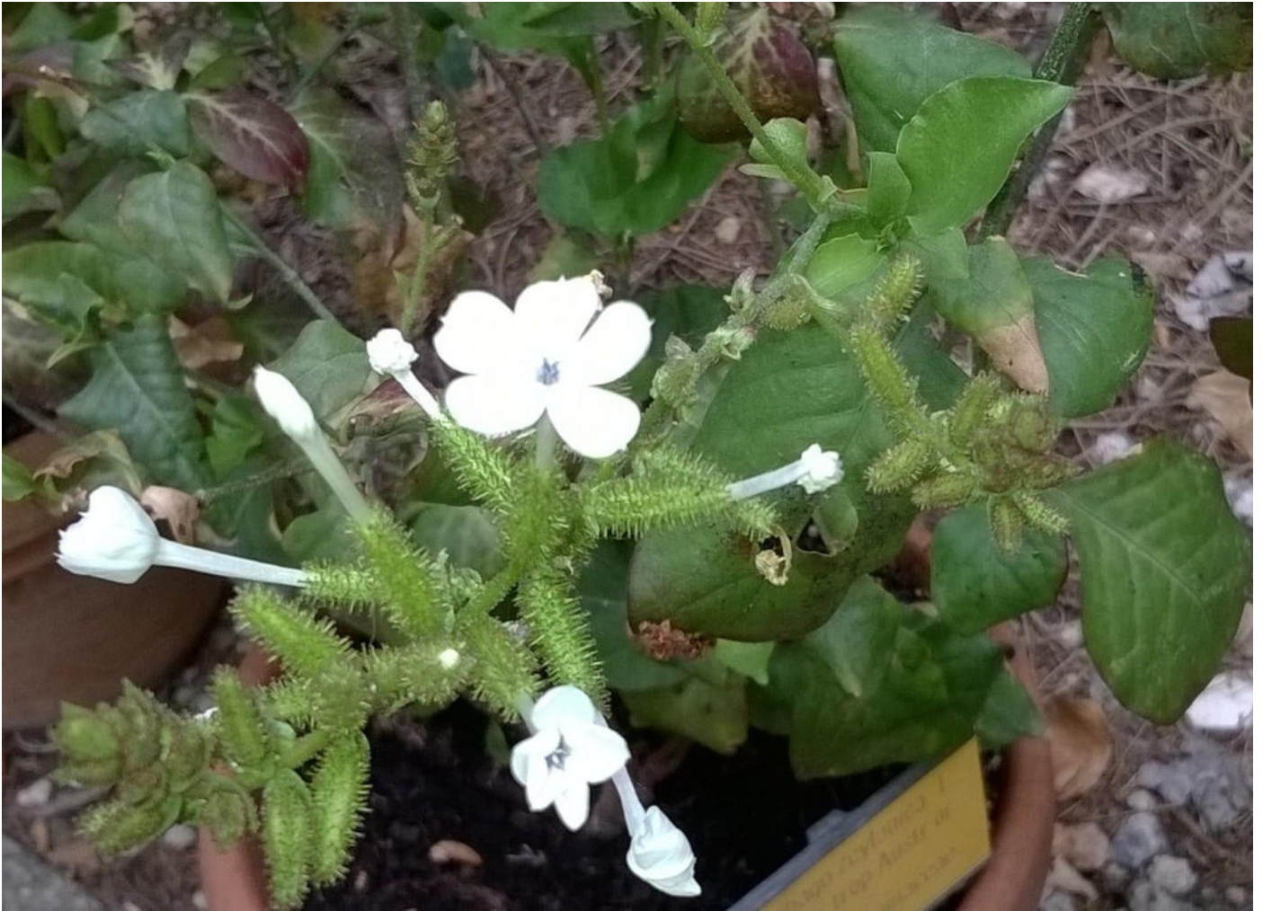
Plumbago zeylanica L.

DIPARTIMENTO DI SCIENZE DELLA VITA ORTO BOTANICO Museo Botanico UNIVERSITA' DI SIENA Via P.A. Mattioli, 4 - 53100 SIENA (ITALIA)